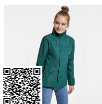
EUROPA WOMAN PK5078