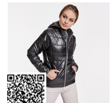
GROENLANDIA WOMAN RA5082