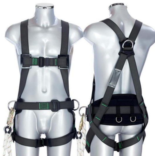
C41 DINAMIC PLUS