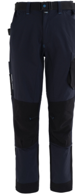
01 - BLEUMARIN