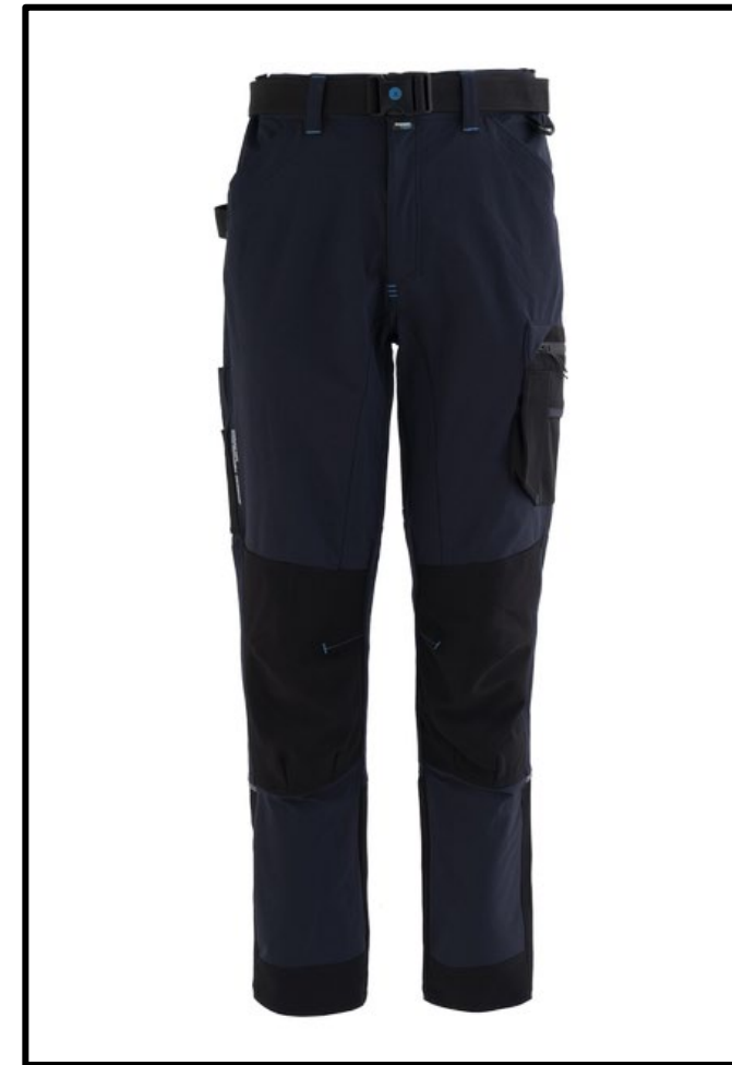
01 - BLEUMARIN