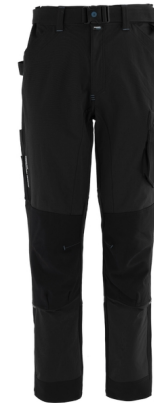
05 - NEGRU