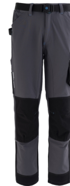
12 - GRI