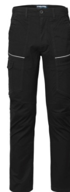
05 – NEGRU