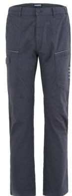
12 – GRI