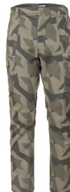
1C – CAMUFLAJ