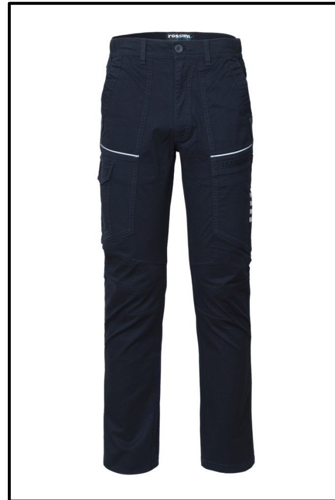
01 – BLEUMARIN