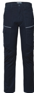
01 – BLEUMARIN