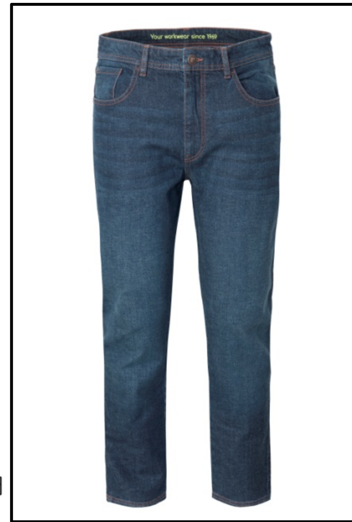
01 - BLEUMARIN