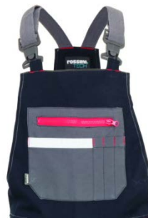
01 – BLEUMARIN