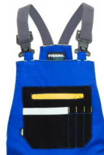
06 – ALBASTRU REGAL