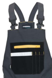
12 – GRI