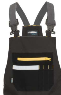
91 – WARM GREY