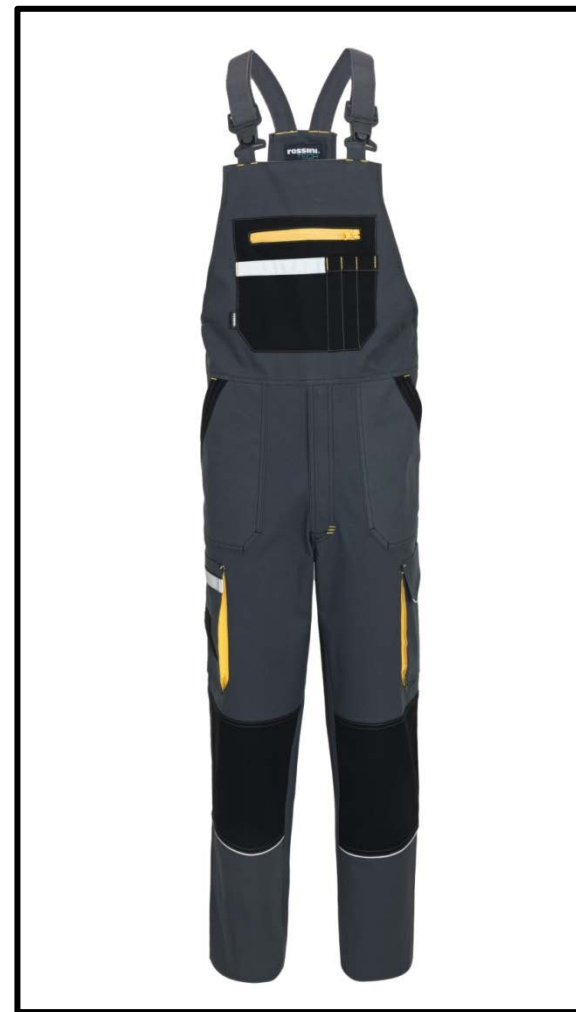
12 – GRI