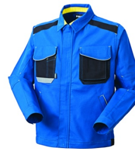
06 - ALBASTRU REGAL