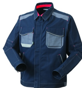
01 - BLEUMARIN