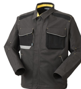
91 - WARM GREY