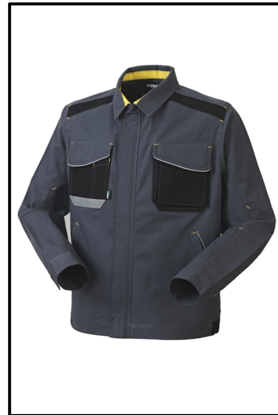
12 - GRI