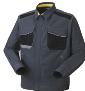
12 - GRI