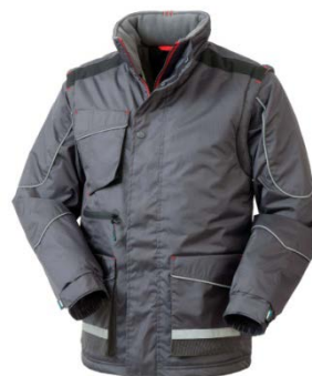
12 – GRI