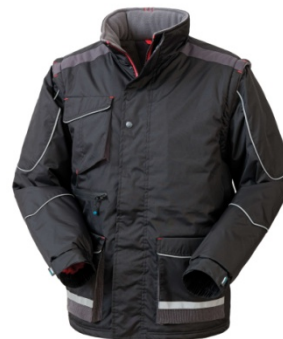
05 – NEGRU