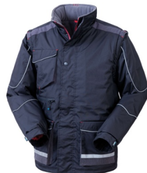
01 – BLEUMARIN