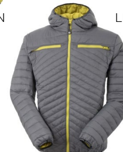
I2 - GRI