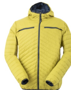
LA - LEMON