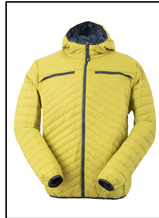
LA - LEMON