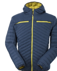
LE - LEGION BLUE