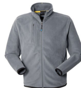
12 – GRI