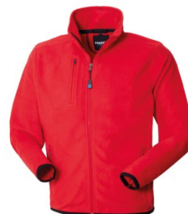
07 – ROȘU