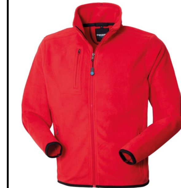
07 – ROȘU