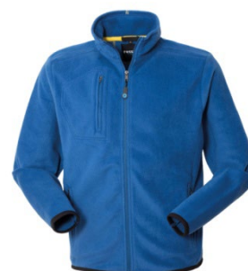
06 – ALBASTRU REGAL