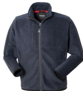
01 – BLEUMARIN

De la S doar pentru 02-alb, 05-negru, 12-gri