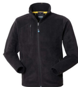
05 – NEGRU