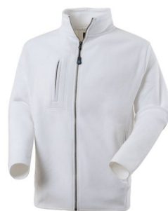
02 – ALB